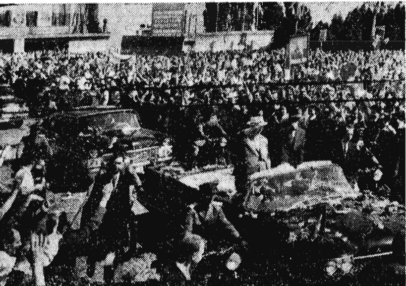
Radziecka delegacja partyjno-rządowa w Rumunii

Jak już informowaliśmy, do Rumunii przybyła radziecka delegacja partyjno-rządowa z N. S. Chruszczowem na czele.