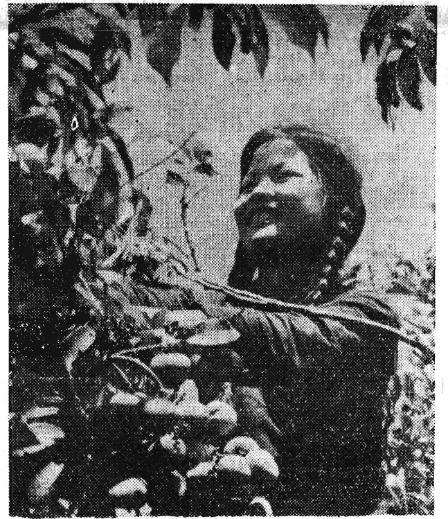
Zbiór owoców w prowincji Kwantung. Ta podzurobnikowa prowincja Chin dostarcza owoców przez cały rok.

Bilety wstępu w cenie: 10, 15 i 20 zł można już nabywać w Garnizonowym Klubie Oficerskim w Rzeszowie, i w dniu występu, w godzinach od 10 do 18, w kasie obok hali.