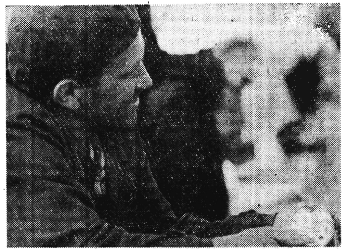
Tutaj i czas się nie dłuży. W oczekiwaniu aż 'będzie brała' można przesiedzieć i cały dzień.