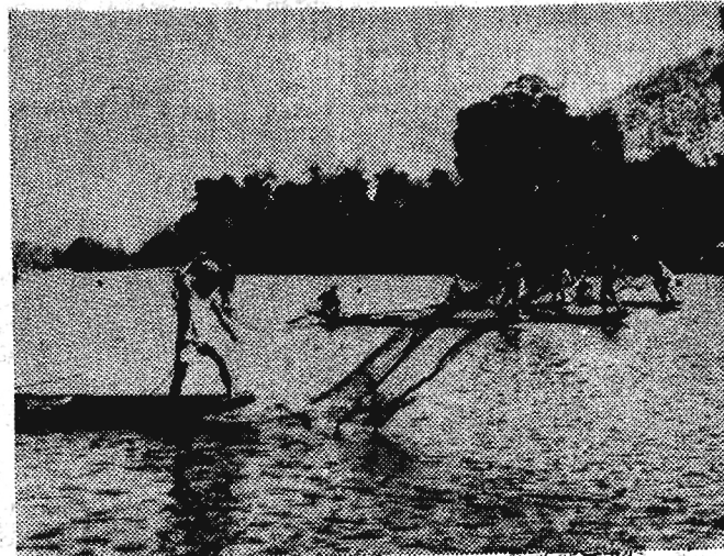
LAOS — OKRĘG SAM NUA

Sofia Loren i jej mąż Carlo Ponti przybyli do Hollywoodu z Nowego Jorku. Zgodnie z tradycją, Sofia Loren musiała sióżyć odcinki stóp i rąk na betonie przed teatrem chińskim Grauman w Hollywood. Ponadto na betonowej płycie wypisała swoje nazwisko oraz słowa „solo per sempre”.