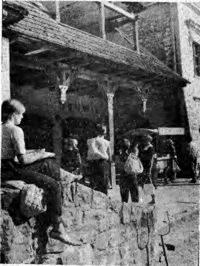
Z WĘDRÓWEK PO KRAJU