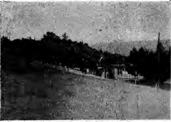
Fragment ośrodka campingowego Huty Stalowa Wola w Myczkowcach.