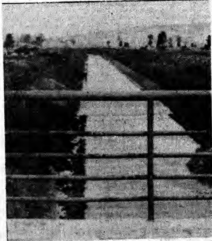
U góry: po regulacji. Fot. i tekst (ap)