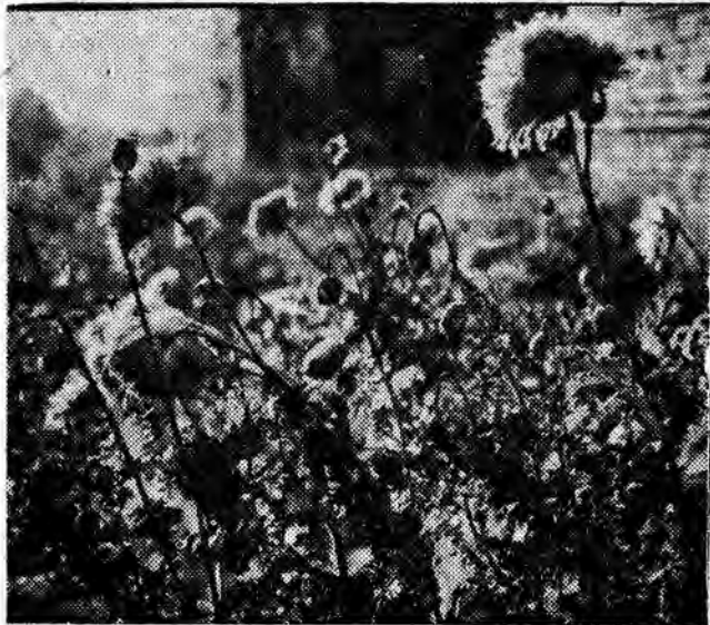
Na zdjęciu: ładnie utrzymane maki na kwiatniku obok bloku nr 31 przy ul. Staszica.

Rozdanie nagród nastąpi w październiku br., po ostatecznym rozstrzygnięciu konkursu, który trwał będzie do końca września.