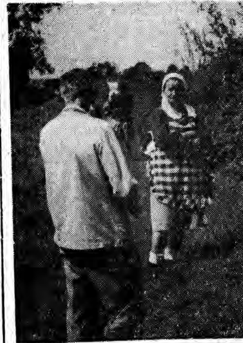
U dołu: palowanie brzegów rzeki.

Mała rzeczułka, porośnięta wami — w okresie wiosennych czy jesiennych deszczów daje się dobrze we znaki. Często za lewą całą okolicę. A łąki tu liche, siano mar-