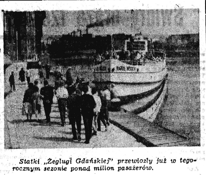
Statki „Zegluga Gdańskiej” przewoziły już w tegorocznym sezonie ponad milion pasażerów.