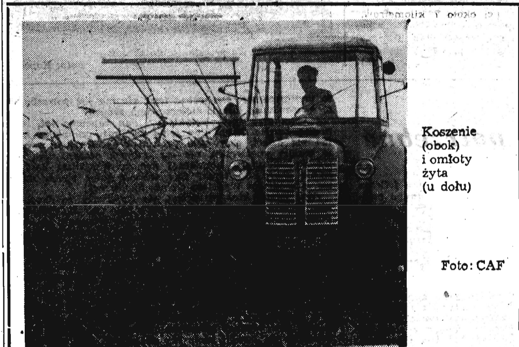
Koszenie (obok) i omłoty żyta (u dołu)

Idąc wieczorem głównymi ulicami Przemysła — można podziwiać, jak są one ładnie oświetlone. Ile to światła jeszcze przybędzie, gdy powstaną w mieście nowe hale fabryczne i budynki mieszkalne. Tak jak to się bez przerwy dzieje wszędzie.