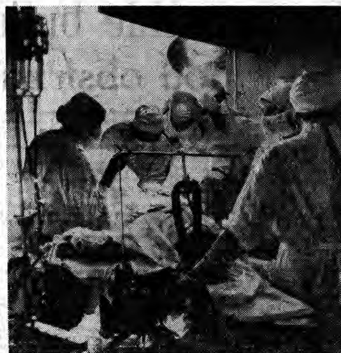
Podstawowym zadaniem Instytutu Naukowego Onkologii Akademii Medycznej ZSRR w Moskwie jest poszukiwanie nowych metod i środków leczenia rólowych nowotworów. Liczne kliniki Instytutu przeprowadzają doświadczenia nad stosowaniem preparatów hormonalnych w kombinacji z chirurgicznym i promieniowym sposobem leczenia. W laboratoriach bada się powstawanie i rozwój nowotworów na różnych rodzajach zwierząt. Na zdjęciu: zabieg chirurgiczny w jednej z sal operacyjnych Instytutu.

Liga okręgowa po pucharowych emocjach wraca do normalnych „fajek”. Na czoło wybiła się mecz: Wisłoka — Bieszczady, Czujaw — Polonia i Resovia — JKS. Huśtawka formy drużyn ligi okręgowej jest tak zaskakująca, że nie warto otwarcie prognozować. Kto by się spodziewał np. wysokiego zwycięstwa rezerwy Stali Mielec nad rezerwą I-ligowej Stali Rzeszów. Prawie nikt, a jednak każdy wynik jest w sporcie możliwy, tak jak możliwe są dorobki i straty w nadchodzącą niedzielę.