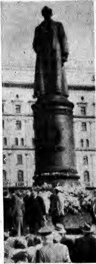
W 85. rocznicę urodzin Feliksa Dzierżyńskiego odbyła się w Moskwie 11 bm. uroczystość składania wieńców przed pomnikiem wielkiego rewolucjonisty.