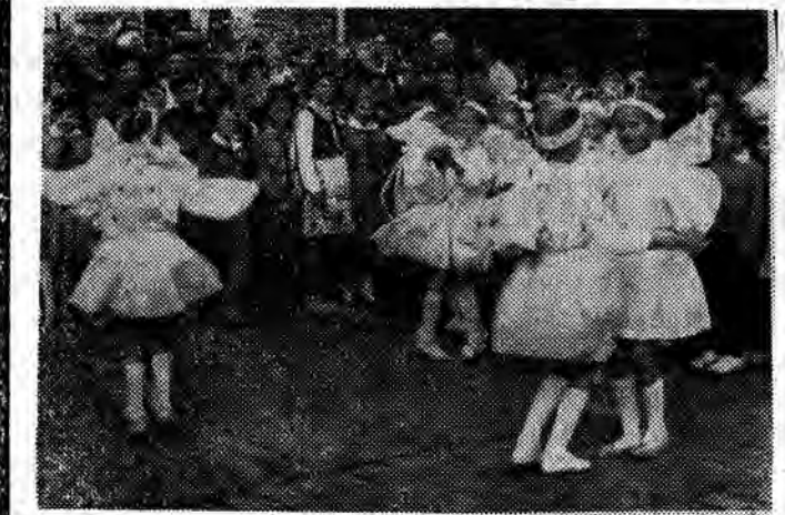
Zespół taneczny ze Szkoły Podstawowej w Mogielnicach wystąpił ostatnio z nowym programem.