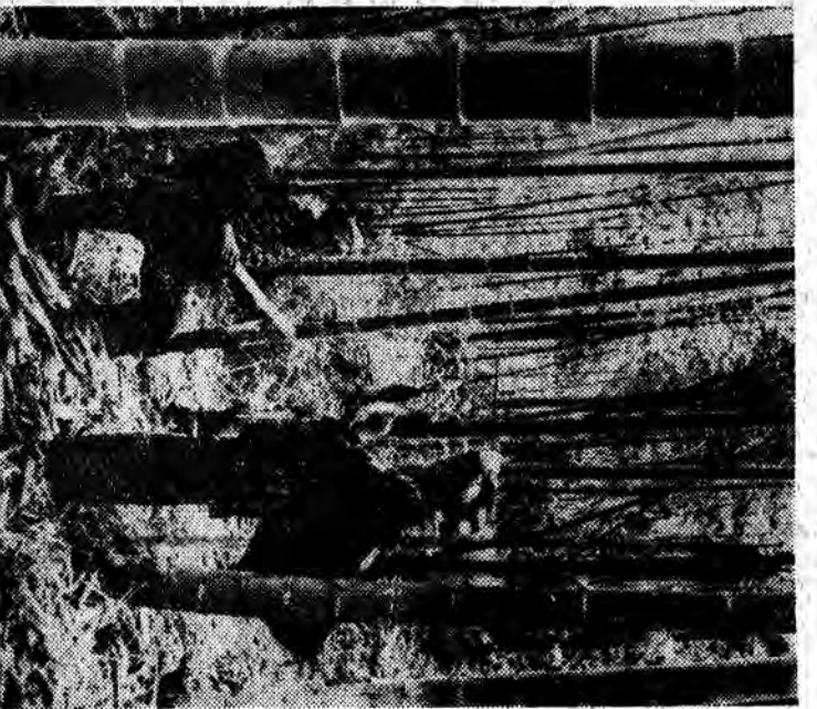
CHINSKA REPUBLIKA LUDOWA. Skoki gór TAYAO w Chinach Południowych...