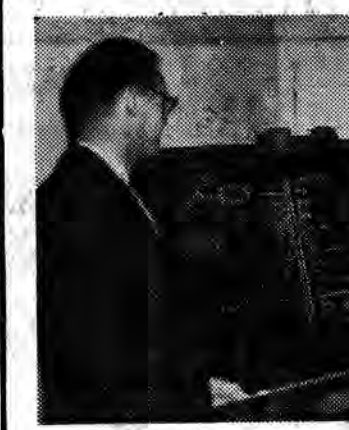
PIŁKA NOŻNA I LIGA

PROGRAM II Program dnia: 7.30 Wiadomości: 7.30, 8.30, 12.05... 14.00 Audycja pt. Głos ma redakcja muzyczna.