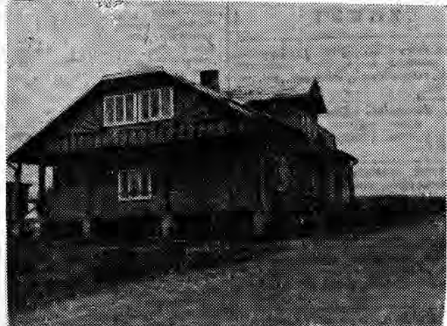
Hotel „Bieszczady“ w Lutówkach.

W ramach inwestycji centralnych, finansowanych przez