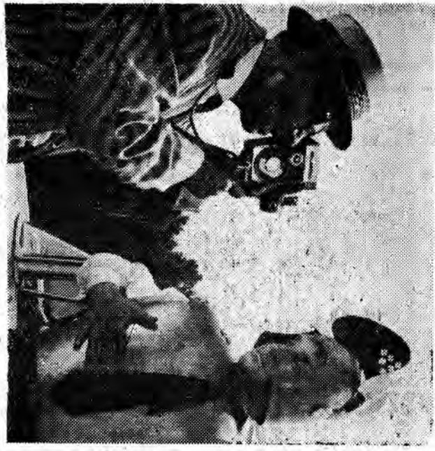
Kadr z filmu "RIO BRAVO"

Uff, narazicie film, po którym ludzie nie wycho- dzą z kina z upiaskanymi mimami. I to film polski, pokazany nam jako ostatni utwór rodzimej produk- cji w ramach DFP. Mowa o nowej komedii "JADA GOSCIE, JADA". Powinnoz jednak "Widokoweg" za- mierza dzis recenzje z tego obrazu, my ogranic- czmy się tylko do polece- nia go czytelnikom naszej rubryki, rezgnując z om- uad (trochę ich jest, zuba- szcza niepotrzebnie, klódc- ce się z resztą filmu i ra- kęce uczucia wielu ludzi, Przejmijmy zatem do na- stępnego filmu, które już uderznie wejść na ekranu- jednym z nich jest koloro-