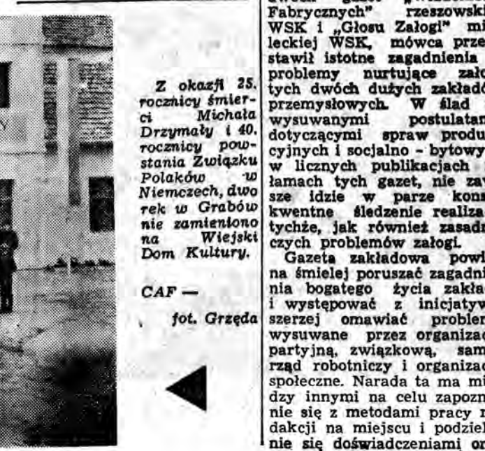
Z okazji 25. rocznicy śmierci Michała Drzymały i 40. rocznicy powstania Związku Polaków w Niemczech...