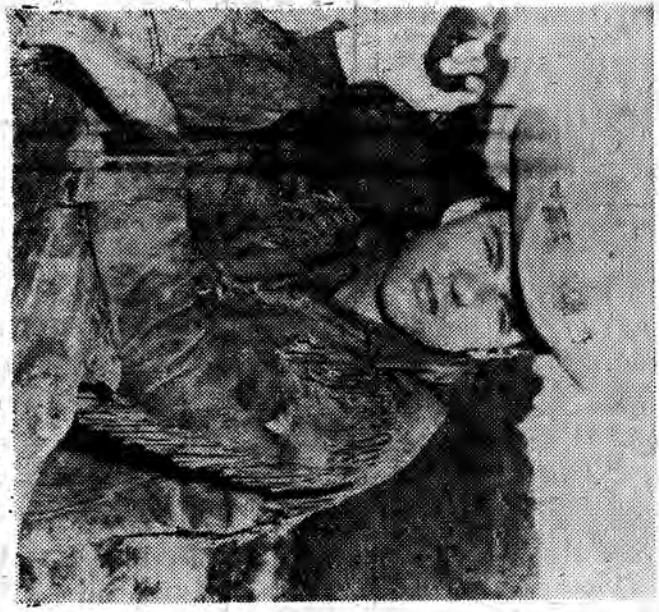
Kadr z filmu "RIO BRAVO"

Uff, narazicie film, po którym ludzie nie wycho- dzą z kina z upiaskanymi mimami. I to film polski, pokazany nam jako ostatni utwór rodzimej produk- cji w ramach DFP. Mowa o nowej komedii "JADA GOSCIE, JADA". Powinnoz jednak "Widokoweg" za- mierza dzis recenzje z tego obrazu, my ogranic- czmy się tylko do polece- nia go czytelnikom naszej rubryki, rezgnując z om- uad (trochę ich jest, zuba- szcza niepotrzebnie, klódc- ce się z resztą filmu i ra- kęce uczucia wielu ludzi, Przejmijmy zatem do na- stępnego filmu, które już uderznie wejść na ekranu- jednym z nich jest koloro-