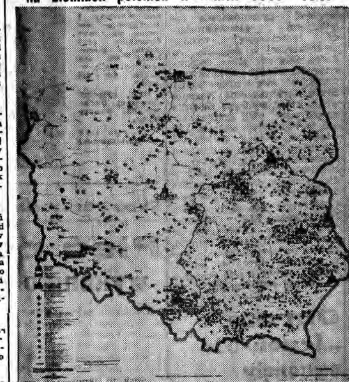
WARSZAWA Staraniem Rady Ochrony Pomników Walki i Męczeństwa...