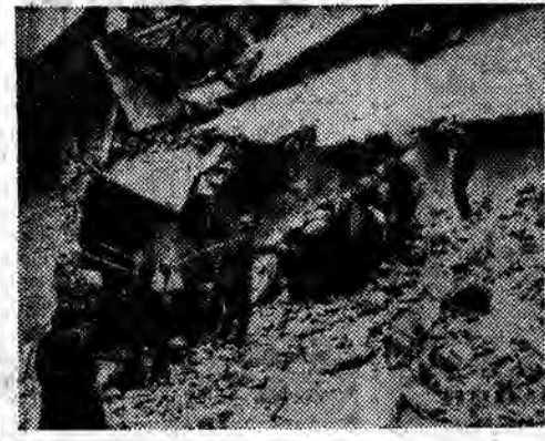
W Brukseli zawalił się 4-piętrowy biurowiec Ministerstwa Spraw Ekonomicznych, grzebiąc pod gruzami kilkudziesięciu urzędników tej instytucji. Śmierć poniosło 15 osób, jednak liczba ta nie jest ostateczna.

W SOBOTĘ premier Nehru przybył do Pałacu Elizejskiego, gdzie przeprowadził rozmowę z prezydentem de Gaullem; premier Nehru był następnie podejmowany śniadaniem przez szefa państwa francuskiego.