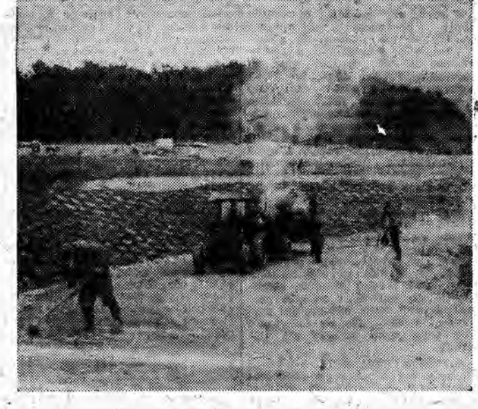
Na plaży bieszczadzkiej

Druga kolejka spotkań o mistrzostwo I ligi bokserkiej obitowała w wielu niespodzianek. Należy do nich w pierwszym rzędzie porażka wielokrotnego mistrza Polski — Legii Warszawa w spotkaniu z BŚTS Bielsko. Drużyna Zbyszka Pietrzykowskiego