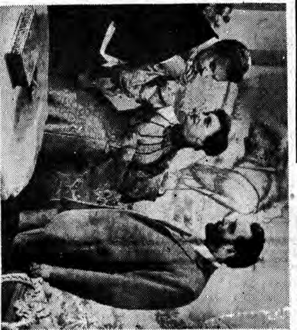
Kadr z filmu „Zmartwychwstanie”

Pół roku czekaliśmy na II serię filmową wiersi łok- stojoskiego. „Zmartwych- ustanie”, ale z zadowoleniem wielkiego pisarza będą z tej bowiem bardzo zblizo na w naszym do podobieci i ugodobujac na plan pierwszy problem obija- jej bohaterów: Kati Masio uiej i księca Michalidowa jest w swej drammatycznej uymowne bardzo wstrząsa- jąca i zmuszająca do rozmy- ślań.