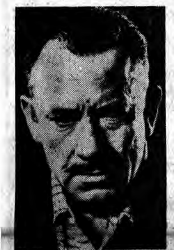
JOHN STEINBECK — pisarz amerykański — laureat Nagrody Nobla.