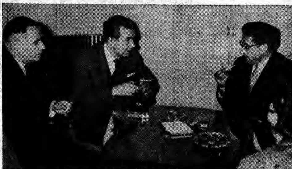
25 X 1962 r. przybył do Warszawy przewodniczący Państwowego Komitetu Rady Ministrów ZSRR do Spraw Wymiany Kulturalnej i Naukowej z Zagranicą — S. K. Romanowski. W godzinach popołudniowych gościem radzieckiego przyjął minister spraw zagranicznych PRL Adam Rapacki. Na zdjęciu: podczas wizyty (od prawej) S. K. Romanowski, A. Rapacki, ambasador ZSRR w Polsce A. Aristow.