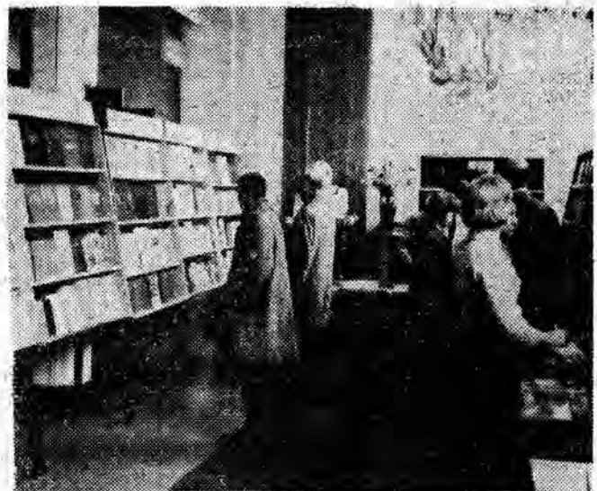
Na zdjęciu: zwiedzający oglądają wystawę.

Stołeczny „Dom Książki” z okazji „Dni Książki Radzieckiej” otworzył w lokalu Głównej Księgarni Technicznej wystawę — kiermasz książki radzieckiej. Ekspozycja obejmuje około 1000 tytułów, reprezentujących szeroki zakres wydawnictwa od książek naukowych do literatury dziecięcej.