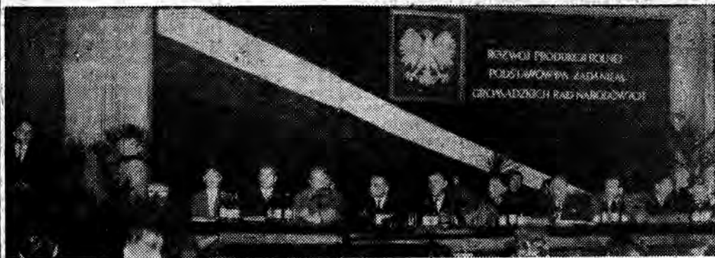
Na zdjęciu: prezydium wojewódzkiej narady przewodniczących rad narodowych.