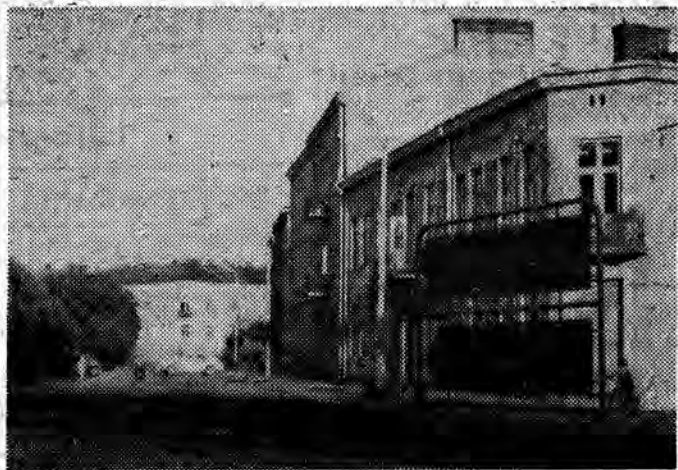
Z wędrowek po Rzeszowie...

Mgr Pleśniarowicz odczytał również tłumaczone przez siebie, a nieznane polskim czytelnikom, wiersze poetów radzieckich. Z. K.