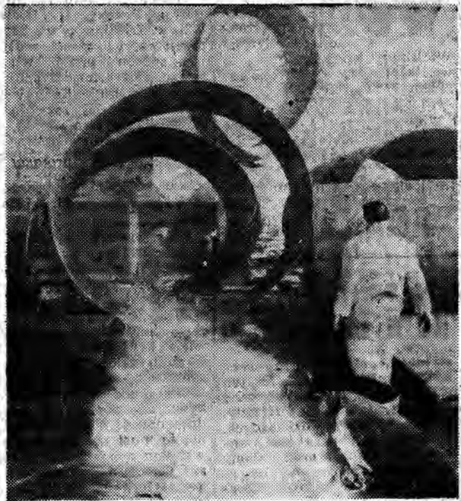
BULGARSKA REPUBLIKA LUDOWA. Prace spawalnicze w fabryce kotłów im. G. Kirkowa w Sofii.

dźwiękowych (pacjentowi nakłada się na uszy specjalne słuchawki, połączone z aparaturą stanowiącą jak gdyby kombinację telefonu i magnetonu) człowiek zaledwie w ciągu kilku minut zasypia bardzo głębokim snem. Wybitni lekarze twierdzą, że tak rozumiana hipnoza ma przed sobą wielką przyszłość.