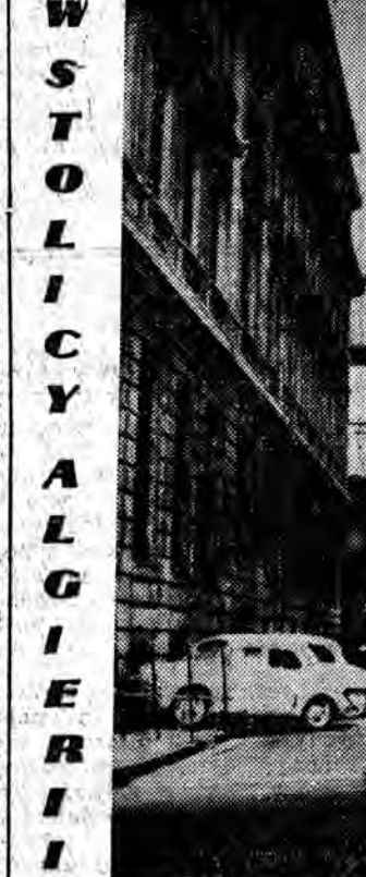
Ulica MENERVILLE — malowniczy zaułek nosi jeszcze ślady walk z OAS i francuskimi kolonizatorami. CAF