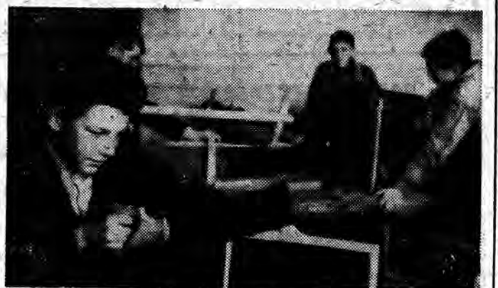
W pracowni robót ręcznych.

dzie się już do tego przyzwyczaiła. W przyszłym roku rozpocznie się budowę nowej szkoły, będą w niej już osobne pomieszczenia na pracownię z prawdziwego zdarzenia. Cieszymy się bardzo, bo nasza poczciwa starszuszka z trudem mieści sporą „gromadkę” - liczącą 400 uczniów.