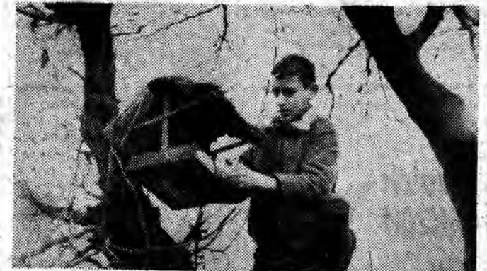
Harcerze pamiętają o ptakach

Choć już dawno po lekcjach, w szkole podstawowej w Świlczy dużo młodzieży. Zbiórka harcerzy i zuchów. „nie pobrudzić tylko klejem rysunków - zwraca uwagę młodszemu kolegowi opiekunka zastępy z klasy VII. Harcerze przygotowują własne albumy, o życiu generała Karola Świerczewskiego. Z albumem pojadą na zlot (po feriach) do Trzcińca.