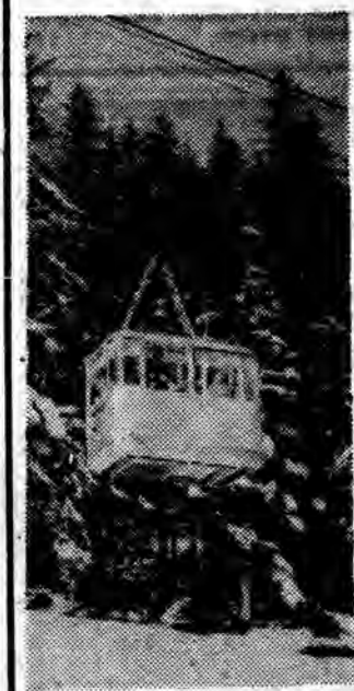
Ostatnio rozpoczęła nową pracę po jesiennym remoncie kolejka linowa na Kasprowy Wierch. Jest to znak, że rozpoczyna się sezon zimowy.