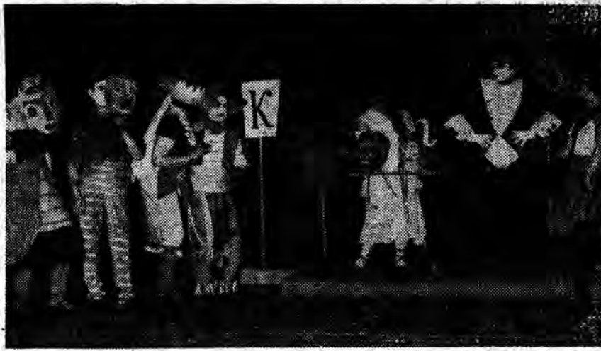
W Łodzi odbywa się obecnie V Ogólnopolski Przegląd Zespołów Artyści Młodzi. Na zdjęciu: zespół „Pantomima Głuchych” z Olsztyna.