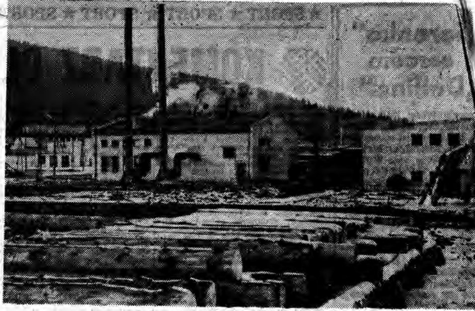
Na zdjęciu: uruchomiony niedawno w Rzepedzi nowo czesny obiekt przemysłowy — kombinat drzewny. Nowy kombinat oddany do eksploatacji na 8 miesięcy przed terminem przewidzianym dla niego.

Na razie wykonano tylko roboty wstępne, zabezpieczające dół fundamentowy przed naporem wody. Obecnie trwają prace przy zasypywaniu kamiennego korpusu grodziny oraz przy robotach budowlano-montażowych. Robotnicy muszą jeszcze m. in. ułożyć 350 m 3 płyt betonowych okładzinowych. Całość prac musi zostać ukończona koniecznie przed mrozami.