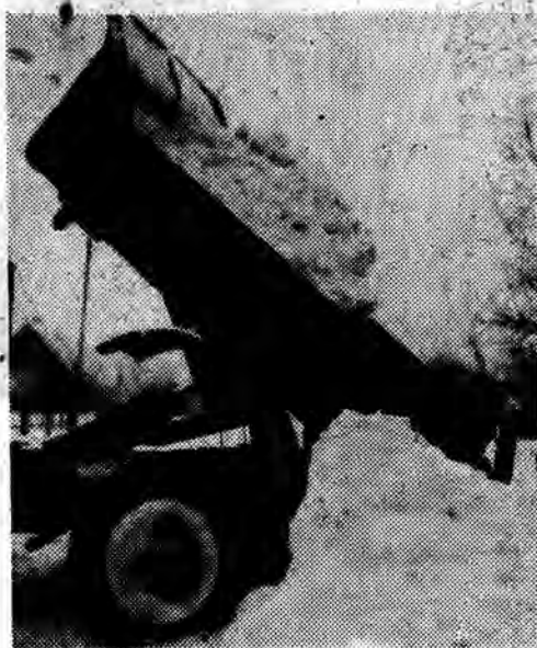
Samochodem i furmankami wywożą śnieg do Wistoka.