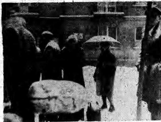
Na przystanku autobusowym.

W drugiej części obrad (robotczej) rada zajęła się problemem przygotowania inwestycji, które będą realizowane w Rzeszowie w roku bieżącym.