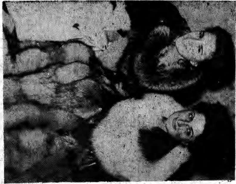
NA AUKCJE SKOR W LON'DYNIE

Styczeńskiego NOWEGO ROKU okładka nowym nowościom do lat 100, Jacy, Jacy, Klona Td Riemowia