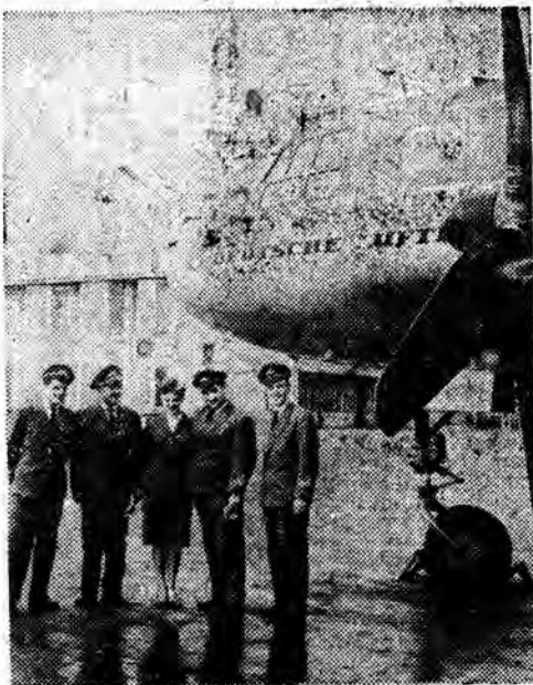
5 bm. Linie Lotnicze Deutsche Lufthansa (NRD) rozpoczęły regularną obsługę na trasie Berlin — Warszawa. Chwilowo samoloty Lufthansy przybywać będą dwa razy w tygodniu. Na zdjęciu: Załoga NRD przed swym samolotem na lotnisku Okęcie w Warszawie.

Prognoza pogody: Na ogół duże zachmurzenie — możliwość drobnych opadów śniegu. Wieczorem słoneczne, pogodzenie. Temperatura dniem od 0 do plus 2 st., nocą ok. minus 4 st. Wiatry słabe, z kierunków południowych.