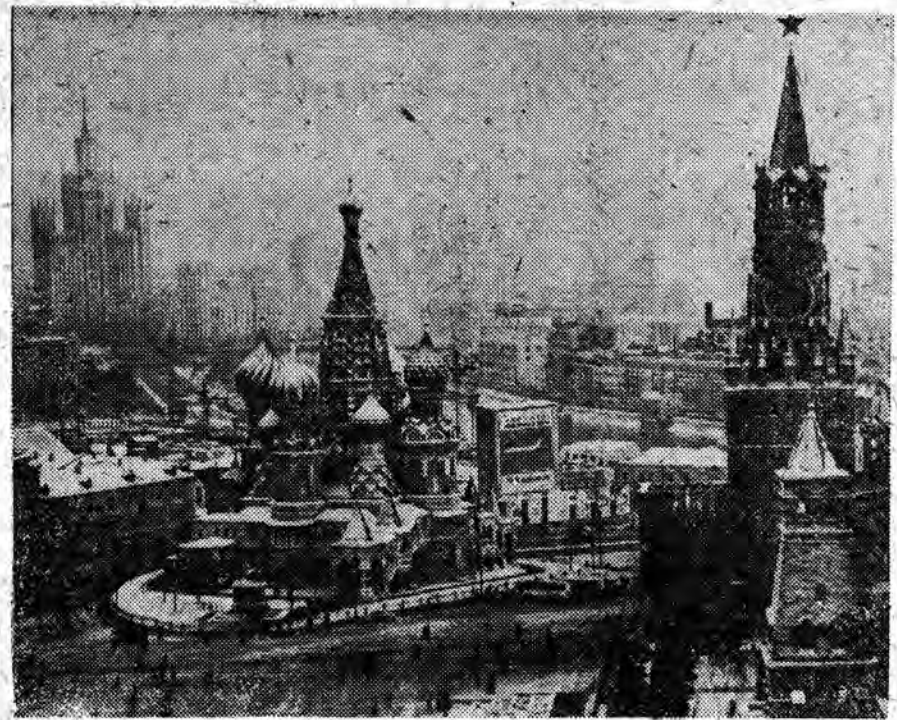
MOSKWA W ZIMIE

W oparciu o wyniki grupowego lotu w kosmos