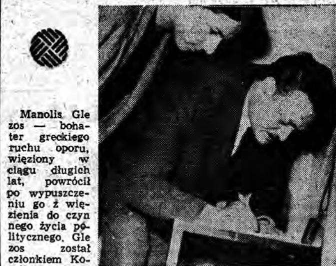
Manolis Glezos — bohater greckiego ruchu oporu, więziony w ciągu długich lat, powrócił po wypuszczeniu go z więzienia do czynnego życia politycznego. Glezos został członkiem Komitetu Wykonawczego Demokratycznej Koalicji Lewicy Greckiej (EDA).

Na zdjęciu: Manolis Glezos podpisuje petycję uczniów i studentów greckich domagających się powiększenia budżetu państwowego na cele oświaty.