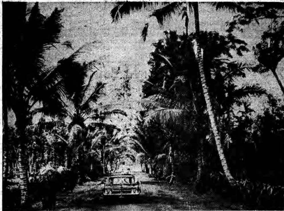
INDONEZJA — Krajobraz z wyspy Bali.