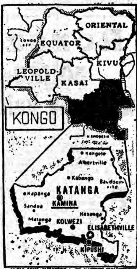
Na zdjęciu: mapa Konga z podziałem na prowincje (u góry) oraz mapa Katangi (u dołu).

P. F. Totalizator Sportowy zawiadamia, że w specjalnym konkursie sportowym „Toto-Lotek” z dnia 6 stycznia 1963 r. stwierdzono: 4 rozwiązania z 6 traf. wygr. po zł 323.114, 9 roz. z 5 prem. traf. wygr. po zł 143.006, 636 roz. z 5 traf. wygr. po zł 2.700, 21.275 roz. z 4 traf. wygr. po zł 202. Ponieważ na rozwiązanie z 3 trafieniami przypadają wygrane ponad 10 zł, wygranych tych nie wypłaca się, a cała pula przypadająca na wygrane tego stopnia, zgodnie z paragrafem 3 pkt. 5 regulaminu, przetrzeźniona została na rozwiązanie z 4 trafieniami.