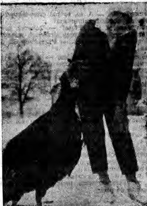
Indyk szero-kopterowy — wysyłany głównie do Anglii.