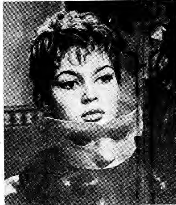
Kadr z filmu „STOKROTKA”