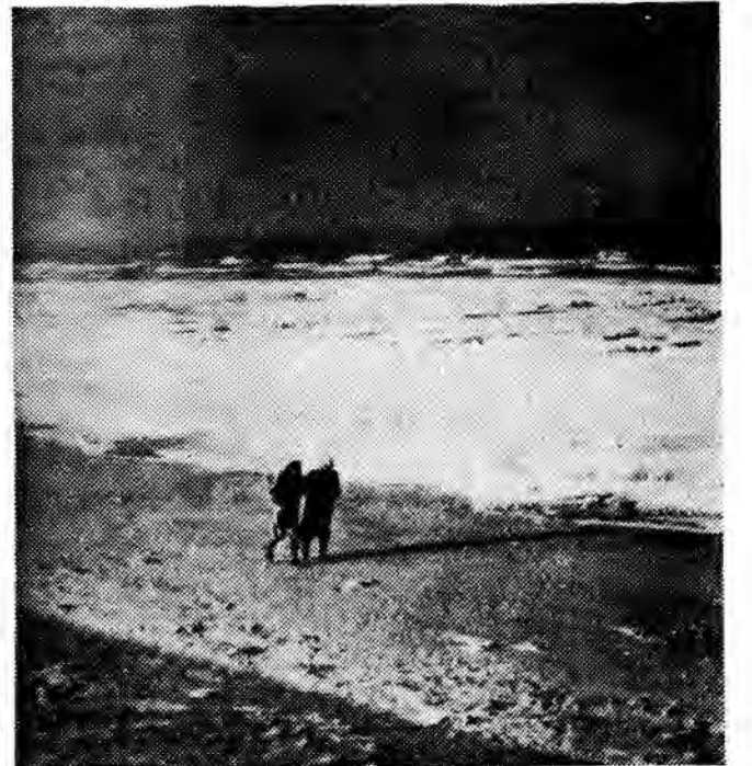
Morze zamarzło u wybrzeży Dunkierki. Ławica lodowa ciągnie się na wschód aż do plaż belgijskich. W niektórych miejscach obejmuje ona ponad 100 m wybrzeża, jej grubość waha się — kolo Malo les Bains sięga 50 cm. Na zdjęciu: ławica lodowa przed plażą w Malo les Bains.