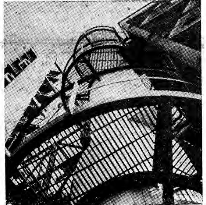
Na zdjęciu: Fragment zespołu urządzeń destylacji rowo-wieżowej w Rafinerii w Głitniku Mariampolskim.