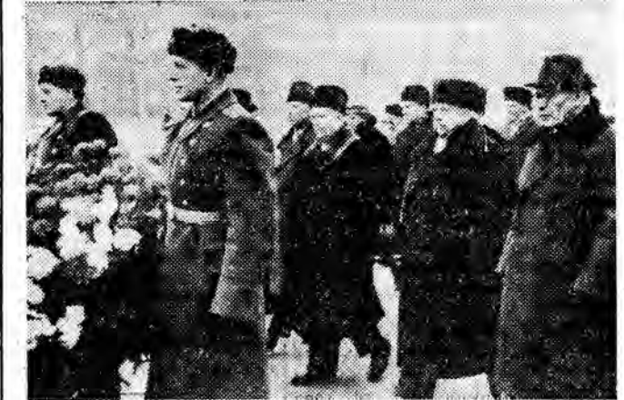
Z uroczystości składania wieńców przed pomnikiem Armii Radzieckiej w Berlinie — TREPTOW. Od prawej: W. Gomułka, Walter Ulbricht, N. S. Chruszczow i N. Podgornyj.