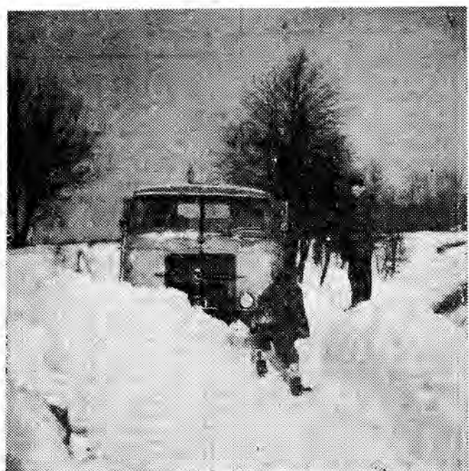
WALKA Z ZIMĄ NA TERENIE KRAJU

Bardzo silna zima nawiedziła Europę w 1956 roku. Oto co pisały nasze gazety: „Zycie Warszawy” z 18 lutego 1956 roku donosi: „Najgorsza zima dwudziestego wieku: w Warszawie 20 stopni mrozu...”