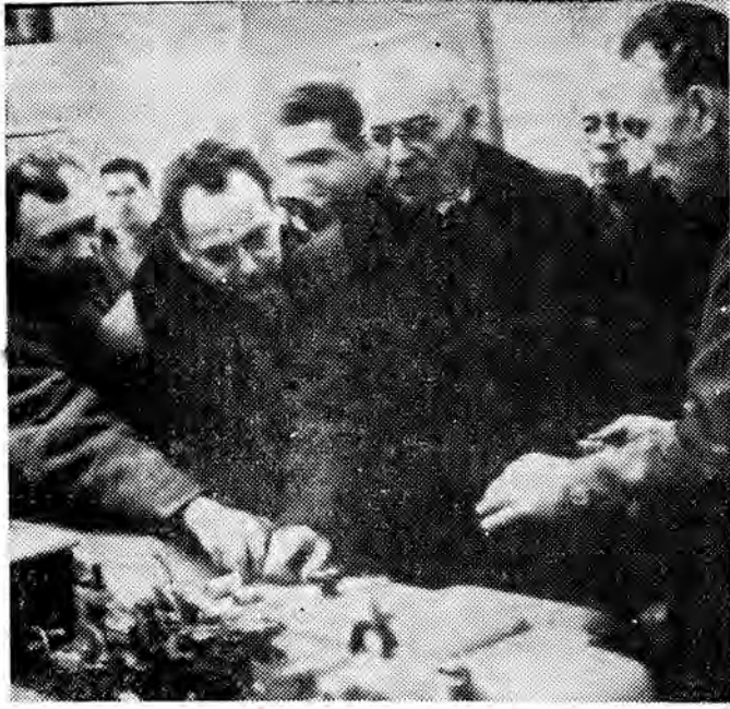
Władysław Gomułka w Berlinie w dniu 19 bm. wystawę osiągnięć NRD.

Otwarto także wystawę poświęconą powstaniu styczniowemu, zorganizowaną przez Muzeum WP przy pomocy Muzeum Narodowego.