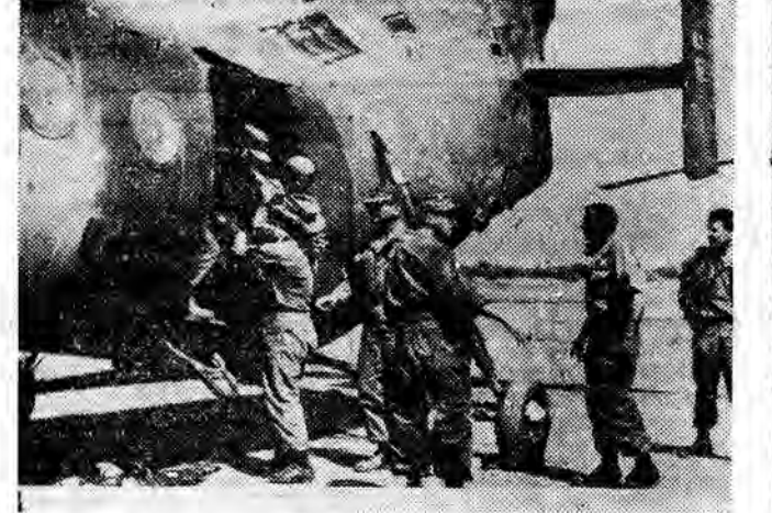
Oddziały partyzanckie w południowym Wietnamie odnoszą ostatnio wielkie sukcesy w walce z oddziałami Diema wspomaganymi przez amerykańskie lotnictwo i szkolonymi przez amerykańskich oficerów, biorących zresztą udział w walkach. Na zdjęciu: amerykański helikopter wywozi z miejsca walki rannych żołnierzy diemowskich.

Prezydium WK ZSL po rozpatrzeniu problematyki obu organizacji podjęło uchwałę zobowiązującą prezydium powiatowych komitetów ZSL do oceny wyników pracy powiatowych ogniw SAiW i TSS, i popularyzacji ich założeń programowych w kołach i gromadzkich komitetach ZSL. (Jaw)