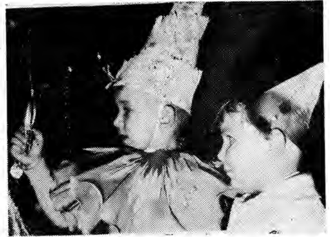
Wychowankowie przedszkola przy ul. Jagiellońskiej przeżyli również swój wielki dzień. Noworoczna zabawa przy choince dostarczyła malcom miłych wrażeń. Słodkie upominki zrobili również swoje.

Niedawno byłem na Śląsku u krewnych. Akurat przyszedł do nich inkasent. Wdalem się z nim w rozmowę. I co się okazało. Nosi zawsze z sobą odpowiednie formularze, któ- re wypełnia się na miejscu. On sam sprawdza, czy fakty- cznie jest pralka, lodówka lub telewizor oraz ile osób jest zameldowanych. Dla odbior- ców prądu jest to duże udo- godnienie. Może by za przy- kładem Śląska wprowadzić taki sposób zatwierdzania spr- awy także i u nas. O wiele prostszy i mniej denerwujący. (j. s.)