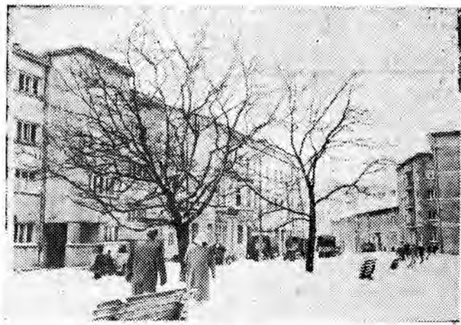
Z zimowych wędrówek.

Zatem całkiem na miejscu i na czasie będzie przypomnienie: nie omijajmy nieszczęśliwych. Niech na ich drodze sztafeta życzliwych poda pomocne ramię i ułatwi im przejście. (js)