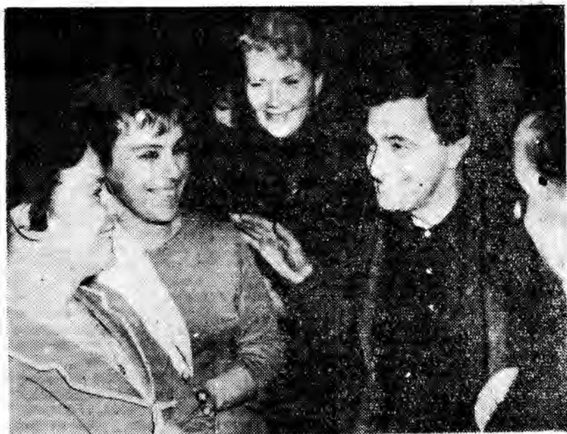
Włoski reżyser filmowy Giuseppe de Santis przebywa obecnie w Związku Radzieckim, gdzie realizuje pierwszy film koprodukcji radziecko-włoskiej „Oni poszli na wschód”.

Koło Łowieckie przy Jednostce Wojskowej w Rzeszowie zajęło się intensywnie dokarmianiem kuropatw. W okolicach Przybyszówki, Trzciany i Swilczy pobudowano dla tego pożytecznego ptactwa specjalne domki — jadłodajnie. Żołnierze dowożą tu codziennie obfite porcje poślada. Podobnie systematycznie dokarmiają zwierzynę na dzierżawionym terenie łowieckim w powiecie jańcuckim. Słowem, wzór dla innych członków Polskiego Związku Łowieckiego. (W)