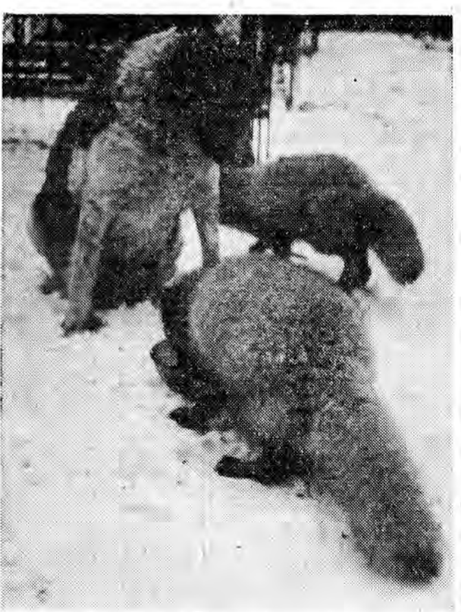
Psy i lisy usiłują jeść z jednej miski.

Przedsiębiorstwa Budownictwa Przemysłowego. Straty ocalały na przeszło 90 tys. złotych. W wsi Wrzawy w pow. tarnobrzeskim wybuchł ostatnio groźny pożar w zabudowaniach należących do ob. Stefani Sundej. Pastwą ognia padł dom mieszkalny kryty słomą. Przyczyną pożaru dotychczas nie ustalono. Straty wynoszą ponad 25 tys. złotych. (f)