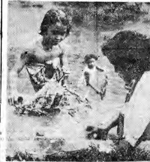
OBIEKTY- WEM PRZEZ SWIAT B O R N E O

Łazienkę zastępuje rzeka. Dziewczęta kąpią się w saunach nawet w tym „zaczysku” głębokiej dżungli.