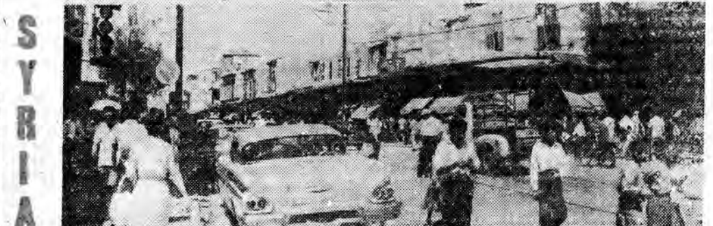
Obrazki z Damasku — dzielnica handlowa.

Męża 25-letniej Elaine Truesdale zatrzymała policja pod zarzutem zabójstwa swej żony.