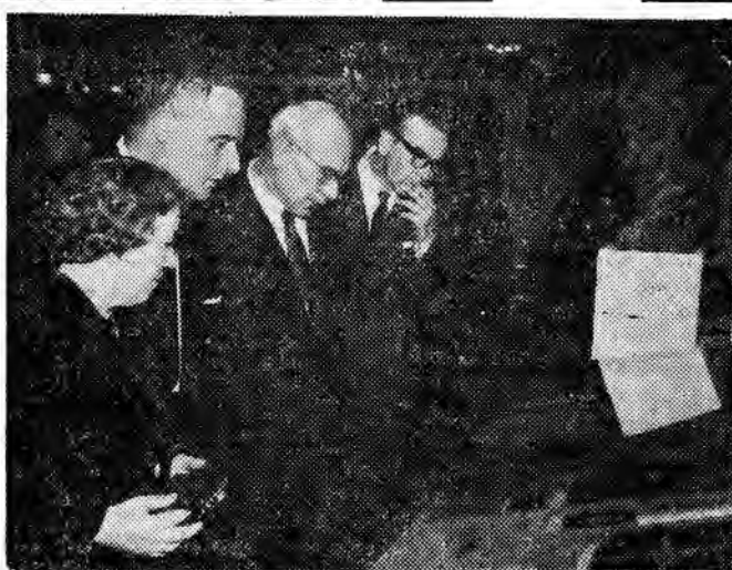
W związku z trudnościami w produkcji papiera „Nowiny Rzeszowskie” przez pewien czas akazywać się będą w zmniejszonej objętości. Redakcja będzie się starała w dalszym ciągu zapewnić Czytelnikom najciekawszy serwis informacyjny-publicystyczny.

W czasie obrad padło wiele konkretnych wniosków, których realizacja winna przyczynić się do wykonania zadań jasielskich wiertników. (m)