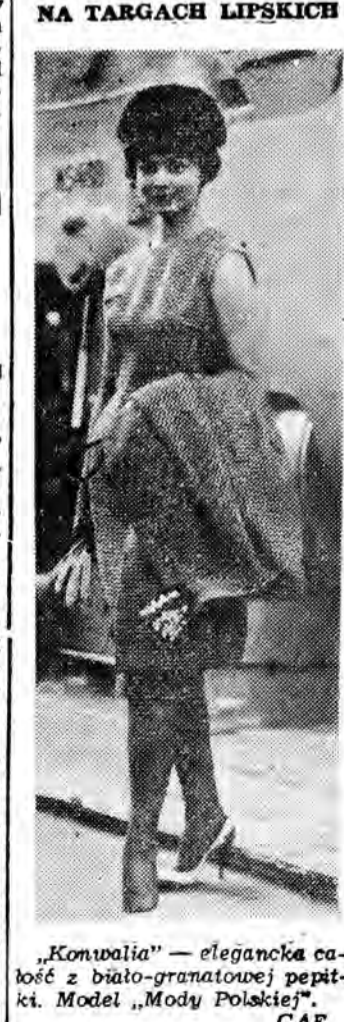
„Konwalia” — elegancka całość z biało-gramatowej papki. Model „Mody Polskiej”.

W najbliższą niedzielę, 17 bm, w kinie „Zorza” w Rzeszowie odbędzie się uroczysta premiera nowego filmu polskiego, reżyserii Jarosława Brzozowskiego i Andrzeja Wróbla „Na białym szlaku”. W rzeszowskiej premierze tego ciekawego filmowego obrazu wezmą udział Alina i Czesław Centkiewiczowie — autorzy scenariusza, opracowanego na podstawie własnej noweli. Przyjeżdżają oni do naszego województwa na zaproszenie WZK, CWF oraz Wojewódzkiej i Miejskiej Biblioteki Publicznej. Poza Rzeszowem A. i Cz. Centkiewiczowie — autorzy popularnych książek o tematyce polarnej odwiedzą Przeworsk, Dębicę i Mielec, gdzie wezmą udział w spotkaniach z młodzieżą i czytelnikami miejscowych bibliotek.