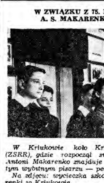
W Kriukowie koło Kremieniczuga, obwód półtawski (ZSRR), gdzie rozpoczął swoją działalność pedagogiczną Antoni Makarenko...

W ZWIĄZKU Z 75. ROCZNICĄ URODZIN A. S. MAKARENKI (13 MARCA 1888 R.)