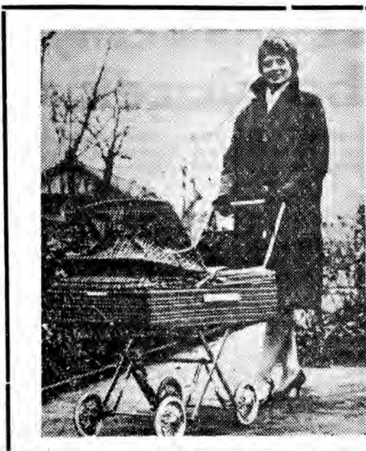
Wózek — walizka

Nareszcie problem wygodnego transportu maluchów rozwiązany! Oto wózek, który w kilku sekundach daje się złożyć i w pokrowcu wygląda jak walizka. Z takim wózkiem nie ma już kłopotu w czasie podróży pociągiem, lub samolotem.