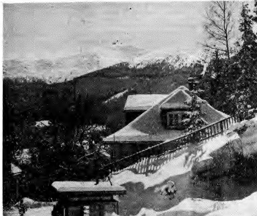
W związku z ostatnimi opadami śniegu w Karkonoszach utworzyły się wymiennie warunki dla narciarzy. Na zdjęciu: w Karpaczu.

stała się środki mające na celu wykonanie planów wydobycia węgla, ropy i rud. Również w hutnictwie oceniono straty w poszczególnych asortymentach i wytyczono kierunki działania zmierzające do nadrobienia zaległości w produkcji koksu, surówki, stali i wyrobów walcowanych.