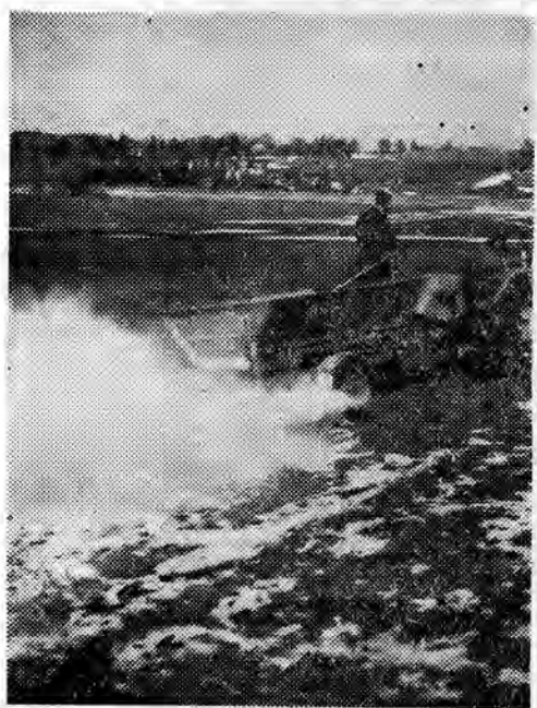
ROLNICY WYSZLI W POLE

TPPR przyjmie w bież. roku w Polsce kilka radzieckich zespołów estradowych. Kontynuowana też będzie wymiana turystyczna.