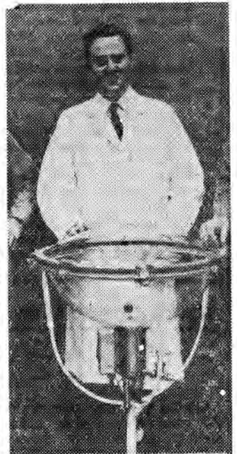
Twórca „sztucznej matki” ze swą aparaturą.

żyła i rozwijała się w plastikowej kuli do chwili właściwych urodzin. Trzeba dodać, że dotychczas nie objęto tym eksperymentem dzieci urodzonych zbyt wcześnie. (mg)