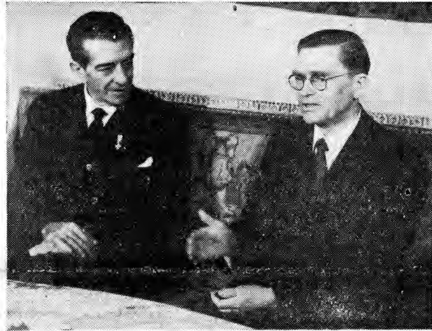
W pierwszym dniu pobytu w Warszawie (1. IV. br.) prezydent Meksyku, Adolfo Lopez Mateos złożył wizytę w Belwederze przewodniczącemu Rady Państwa, Aleksandrowi Zawadzkiemu.

Stąd też w dowód wdzięczności i uznania dla pracy Jednostki KBW społeczeństwo Rzeszowszczyzny w 18. rocznicę powstania KBW funduje swoim żołnierzom sztandar. Najbliższą sobota i niedziela będą dniami głównych uroczystości. Obchody 18-lecia KBW zainauguruje 6 bm. uroczysta akademicka, w której oprócz przedstawicieli władz partyjnych i państwowych oraz wojska weźmie także liczny udział społeczeństwo naszego miasta. W części artystycznej wystąpi z bogatym programem Zespół Pieśni i Tańca KBW.