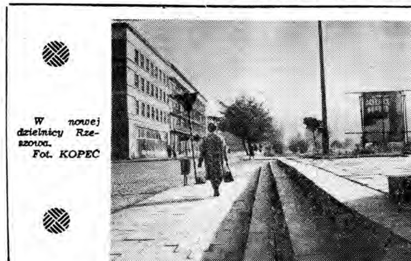
W nowej dzielnicy Rzeszowa.

Ostatnio w miejscowości Procinie wilki napędziły do zakoła Sanu dwa jelenie karpackie (taniec i byka), które nie wytrzymały się z pułapki. Zginęły od wilczych kłów.