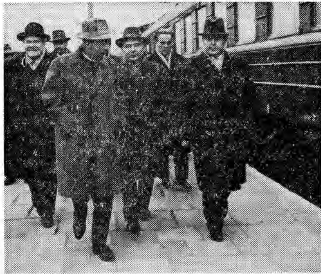
W dniu 2. IV. 1963 r. przybyła do Polski delegacja działaczy partyjnych KPZR, na której czele stoi sekretarz KC KPZR — Wasilij Titow.

W związku ze wzmożonym zapotrzebowaniem na gaz, naftowcy nie wykonali jedynie planu produkcji gazoliny, uzyskując 98 proc. Mimo to przysporzyli gospodarce narodowej dodatkowo produktów wartości ponad 5 mln zł. (m)