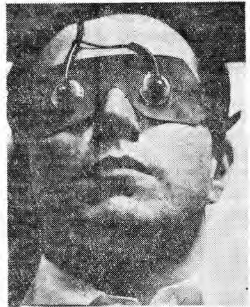
Z elektrosonem na twarzy.