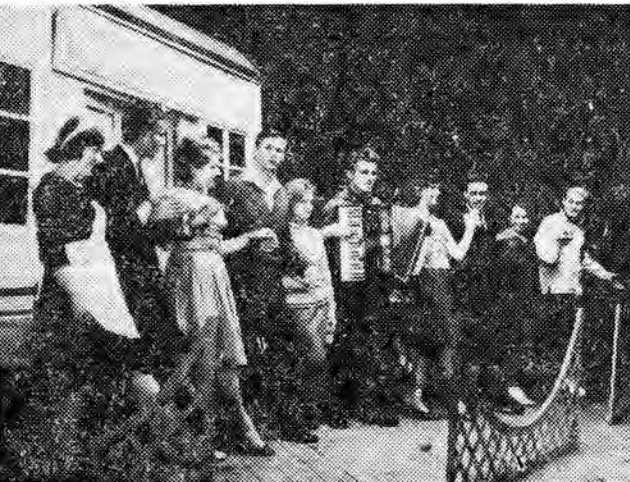
Na zdjęciu: Scena końcowa wodewilu „Wuj z Ameryki” w opracowaniu zespołu teatralnego w Turaszówce.