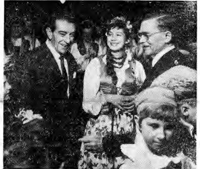
Na zdjęciu: Prezydent Adolfo Lopez Mateos i przewodniczący Rady Państwa Aleksander Zawadzki wśród dzieci szkoły im. Bohatera Meksyku Benito Juareza w Warszawie.

Na zakończenie komunikat wyraża przeświadczenie, że wizyta prezydenta Mateosa w Polsce i przeprowadzone przy tej okazji rozmowy przyczynią się do dalszego zacieśnienia przyjaznych stosunków między obu krajami w interesie obu narodów i w interesie pokoju.