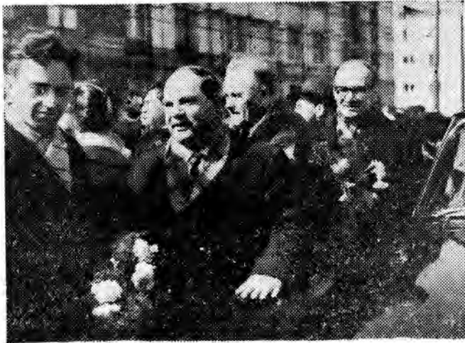
Na ulicach Stalowej Woli społeczeństwo wręczyło członkom delegacji KC KPZR wiązanki kwiatów.