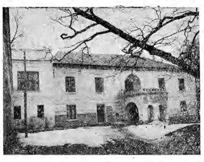
WĘDRÓWKI Z KAMERA Na zdjęciu: zabytkowy zamek w Dubiecku.