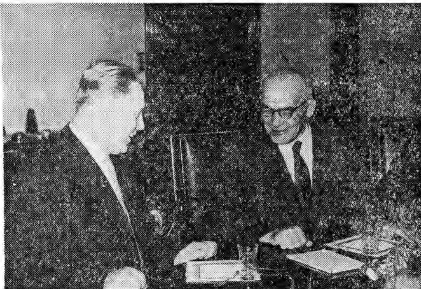
W dniu 12 IV 1963 r. I sekretarz KC PZPR, Władysław Gomułka, przyjął bawiącą w Polsce delegację KC KPZR z sekretarzem Komitetu Centralnego W. N. Titowem na czele.

W nadchodzącym okresie TPP-A kładzie nacisk na szerze informowanie o Polsce ludności w krajach afrykańskich.