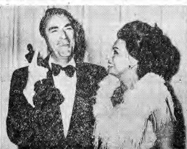
Nagrodę amerykańskiej Akademii Filmowej za najlepszą rolę męską w 1962 r. otrzymał popularny aktor Gregory Peck (ostanie oglądaliśmy go na naszych ekranach w „Białym kanionie”), przyznana mu za kreację w filmie „To kille a mocking-bird”. W filmie tym gra on rolę obrońcy Murzyna oskarżonego o przestępstwo.

Uczestnicy duńskiego marszu pokoju wyruszyli w piątek z miasta Haderslev w kierunku granicy z Niemcami zachodnimi w południowej Jutlandii. Mieli oni przebiec przez terytorium Danii, a następnie NRF. Władze boiskie zabroniły jednak uczestnikom pochodu przekroczenia granicy NRF. Trzy dni trwał pochód przeszło tysiącą francuskich przeciwników zbrojeń nuklearnych z Lozanny do Genewy, wśród których znaleźli się uczestnicy z NRF, Hiszpanii, Włoch i Turcji. W pochodzie przeważała młodzież.