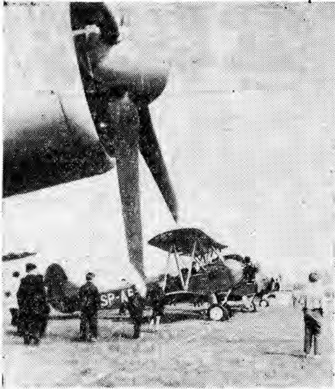
Lotnisko "Aeroklubu Rzeszowskiego w Jasionce.