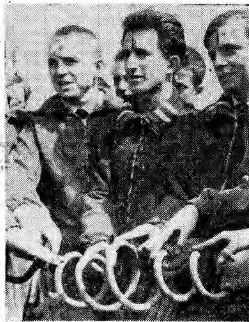
Przysięgli na... metalowy korkociąg.

Z hangaru wyciągają własnie szybowce - wszyscy biegną w tym kierunku, każdy się chce choć dotknąć. Dochodzi godz. 9. Samoloty jadą (tak, po ziemi) na pole legom.