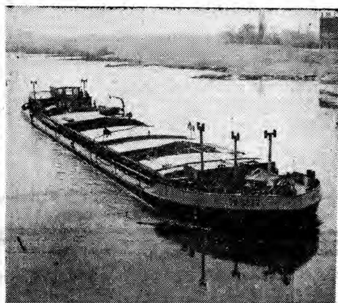
Barki z węglem płyną Odrą przez Wrocław do Szczecina.

W nagród za wyniki osiągnięte we współzawodnictwie ogólnokrajowym i w skali dyrekcyjnej. Następnie odbyła się część artystyczna.