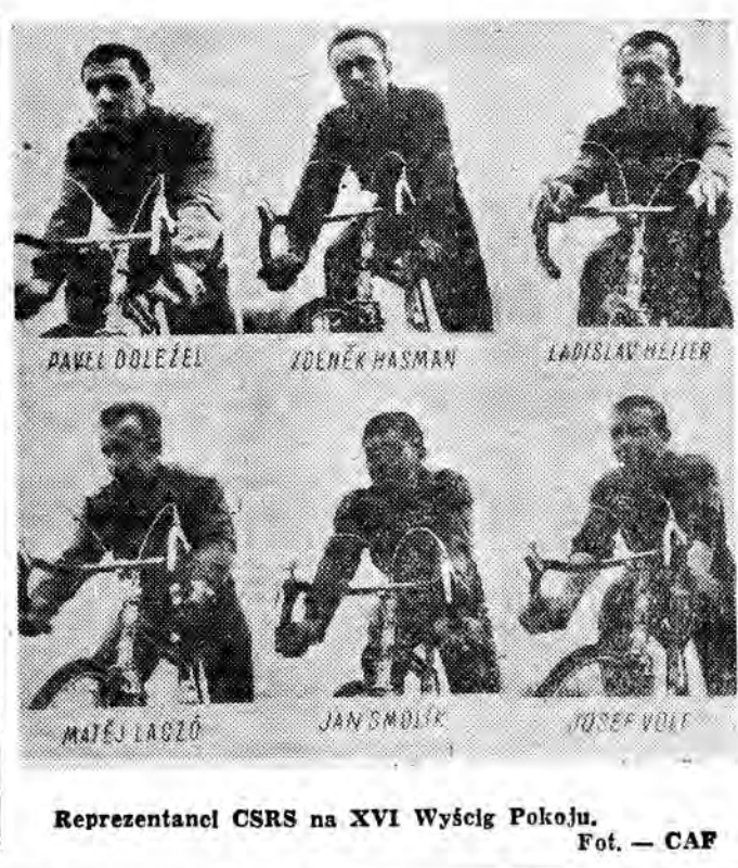
Reprezentanci CSRS na XVI Wyścig Pokoju.

I LIGA ŻUŻLOWA Polonia Bdg. — Stal Rzeszów 42:36 Stal Górzów — Górnik Rybnik 35:40