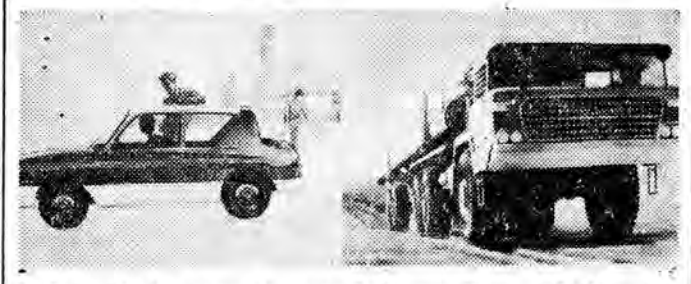
Na zdjęciu: rysunki nowych karoserii samochodów osobowych i ciężarowych, to wspólna praca artystów i inżynierów — konstruktorów.

Niedawno powstał w Moskwie Wszechzwiązkowy Instytut Naukowo-Badawczy dla Spraw Estetyki w Technice. W specjalnym biurze konstrukcyjnym inżynierowie i artyści opracowują projekty nowoczesnej i estetycznej obudowy maszyn i urządzeń, elewacji budynków i formy przedmiotów codziennego użytku.