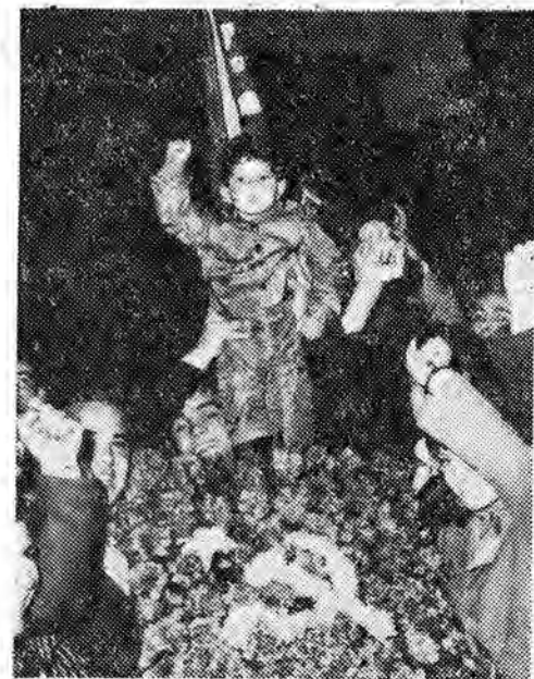
Zwycięstwo Włoskiej Partii Komunistycznej przyjęte zostało z entuzjazmem przez masy ludowe Włoch wywołując jednocześnie zapalenie w kołach politycznych Waszyngtonu i Bonn. Na zdjęciu: grupa uczestników wielkiego wiecu przedwyborczego na skwerze św. Jana w Rzymie, podczas którego przemówienie wygłosił przywódca Wł. PK Palmiro Togliatti. Mały chłopczyk z podniesioną rączką i zaciśniętą pięścią — to symbol programu partii — walki o pokój i powszechny dobrobyt.

KAIR 8 górników zginęło, a około 20 zostało rannych w katastrofie ciężarówki pod Stambulem. Ciężarówka stoczyła się do przepaści na skutek zerwania hamulców. 21 górników jest ponadto kontuzjowanych.