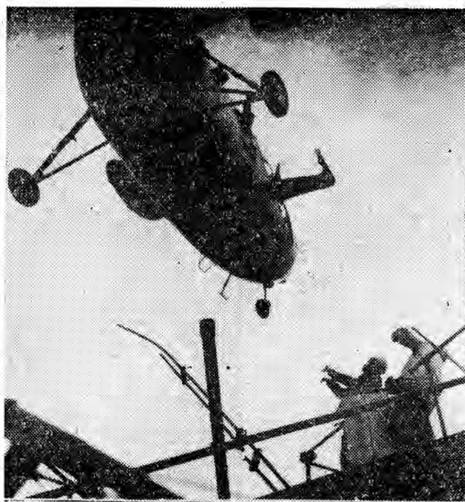
Płocci helikoptera Wojsk Ochrony Pogranicza w Gdańsku dokonałi niecodziennej operacji. Na wysoką 50-metrową wieżę starego zamku w Człuchowie (woj. koszalińskie) wzniesiono za pomocą helikoptera elementy konstrukcyjne telewizyjnej anteny parabolicznej. Operacja ta wymagała dużej precyzji. Przy niezbyt sprzyjającej pogodzie w ciągu 1 godziny 20 minut dokonano 5 „nalotów” na wieżę, aby opuścić na jej platformie elementy konstrukcyjne anteny. Montaż anteny telewizyjnej s powietrza dokonano po raz pierwszy w Polsce. Na zdjęciu: Nad szczyt wieży wznosił się helikopter z elementem anteny.

KAIR Według najnowszych obliczeń w tragicznej katastrofie na Nilu, która wydarzyła się przed czterema dniami w pobliżu miejscowości Maghgha poniosło śmierć ponad 300 osób. Jak wiadomo, osoby te utonęły w nurtach Nilu wskutek wywrócenia się przeladowanego promu. Dotychczas wydobyto z rzeki zwłoki 134 ofiar tragicznej katastrofy.