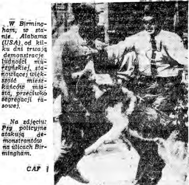
Na zdjęciu: Psy policyjne atakują demonstrantów na ulicach Birmingham.

Kupony zamieścimy w numerze sobotnim (11 V), poniedziałkowym (13 V) i wtorkowym (14 V).