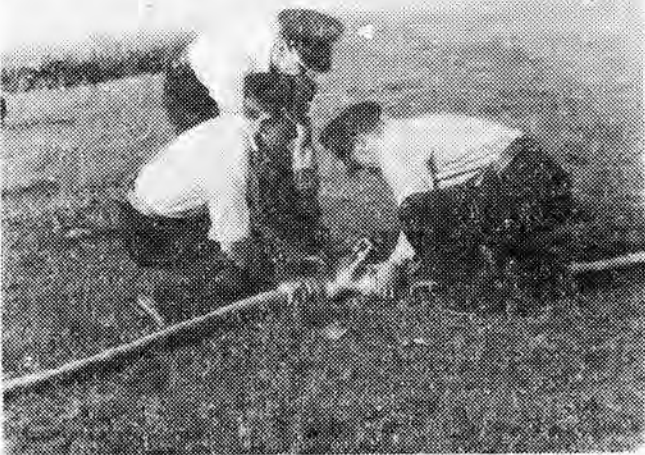
Na zdjęciu: podcaż manewrów przeciwpożarowych...

W oparciu o powiatowy plan obchodu „Dni” w nadchodzącą niedzielę zakończą się wielkie manewry jednostek OSP w Przybyszówce oraz w ramach pomocy sąsiedzkiej odbędzie się 11 rejonowych pokazów sprawności bojowej OSP.