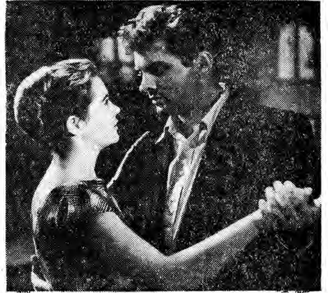
Jeszcze w tym miesiącu na ekrany rzeszowskich kin wejdzie dramat psychologiczny produkcji radzieckiej „Długi dzień”, reżyserii Rafala Goldina.

Lody nam smakują — to widać. O tym, że gardziółko może zabolęć na razie nie mamy czasu myśleć. A karmisji sanitarnej podpowiadam, że wylężone na zewnątrz wafelki bardzo łatwo przyjmują kurz, nawet nie przy wtętrzym dniu. Za to podobno się... karci.