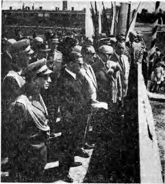
Na zdjęciu: podczas uroczystości — do zgromadzonych przemawia Aleksander Zawadzki. Na pierwszym planie — Marian Spychalski. Obok przewodniczącego Rady Państwa, Aleksandra Zawadzkiego — Ryszard Strzelecki.