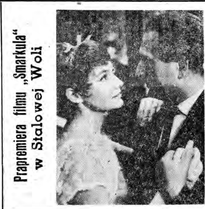
Prapremiera filmu „Smarkuła” w Stalowej Woli

W Ameryce opatentowano ostatnio wynalazek z dziedziny konserwowania żywności przy zastosowaniu bardzo niskich temperatur. Nowy ten sposób polega na wprowadzaniu płynnego azotu do opakowań zawierających produkty spożywcze. Jak wiadomo, płynny azot wrze i zamienia się w gaz przy minus 196 stopniach. Następuje to tym bardziej gdy zetknie się z powierzchnią lekko zamrożonego, a więc stosunkowo o wiele cieplejszego produktu, który ulega trwałe konserwacji. Azot w stanie gazu wypiera wówczas całkowicie powietrze z danego środka spożywczego. Po hermetycznym zamknięciu opakowania środek ten zabezpieczony jest wówczas całkowicie przed zepsuceniem i to na dłuższy okres, pozwalający transportować go na dalekie odległości. Pierwsze próby przesyłania tak konserwowanej żywności z Nowego Jorku do Japonii i Cejlonu wypadły dodatnio. Po rozpakowaniu okazało się, że wszelkie produkty zachowały całkowicie świeży wygląd, smak zaś ich nie uległ żadnej zmianie.