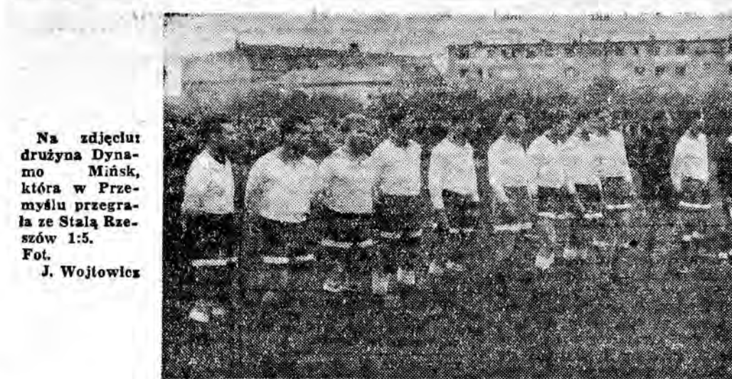
Na zdjęciu: drużyna Dynamo Mińsk, która w Przemyslu przegrała ze Stalą Rzeszów 1:5.