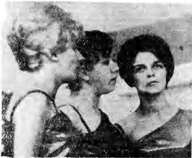
Tercet żeński z Rzeszowa.