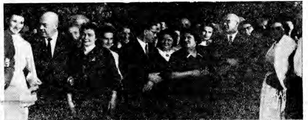
Na zdjęciu: członkowie kierownictwa partii i rządu podczas spotkania z uczestnikami II Krajowego Zjazdu Kółek Rolniczych w parku belwederkim.