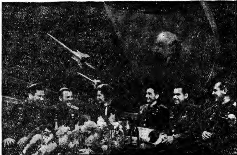
Radzieccy kosmonauci wystąpili przed kamerami TV w Moskwie. Od lewej: Popowicz, Gagarin, Tierszkowa, Bykowski, Nikołajew i Titow.

Jak dowiaduje się moskiewski korespondent PAP, na porządku dziennym znajdują się kolejne, ważne zagadnienia współpracy w przemyśle maszynowym, sprawozdanie z prac komisji węglowej, a także problemy handlu zagranicznego i komunikacji.