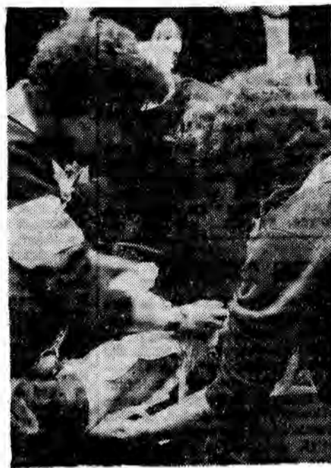
„...tym razem sprawne sanitariuszki bandują nogę... „na niby”.