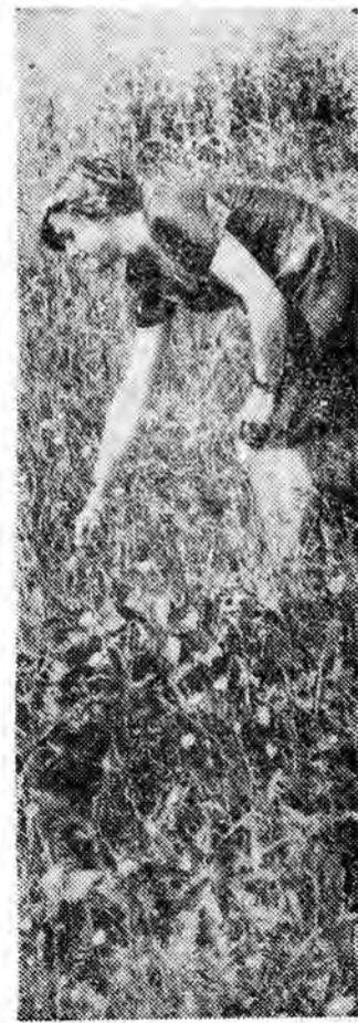
Wśród kwiatów

Setki głuchoniemych w naszym województwie chodzą bez pracy, kołatają do biur i urzędów. Żyją z łaski litościwych ludzi, jeśli nie mają już bliskich, cierpią nędzę. Obok drukarni w Rzeszowie jest mikroskopijny hotelik — aży dla najbardziej potrzebujących, uczących się zawodu itp. Pomieścić jednak może tylko 7 osób. Nie roz-