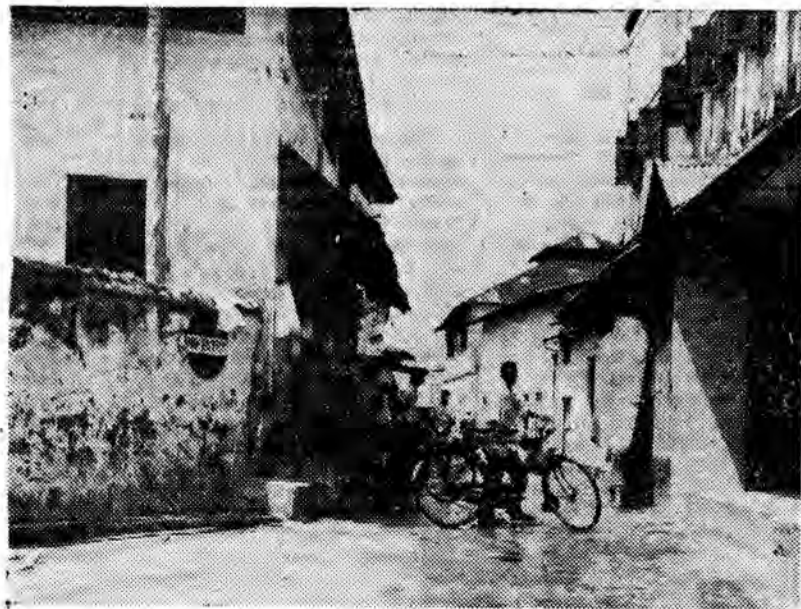
OBIEKTWEM PRZEZ ŚWIAT ZANZIBAR. Scenka uliczna.

82 kraje kupują obecnie polskie materiały budowlane, wytwórnie materiałów, korzystają z usług budowlanych świadczonych przez nasze przedsiębiorstwa. Analiza zagranicznych rynków wykazała, że istnieje — zwłaszcza w krajach rozwijających się — duży popyt na te właśnie kompletne obiekty, które zaoferować może krajowy przemysł. Warto te szanse wykorzystać.