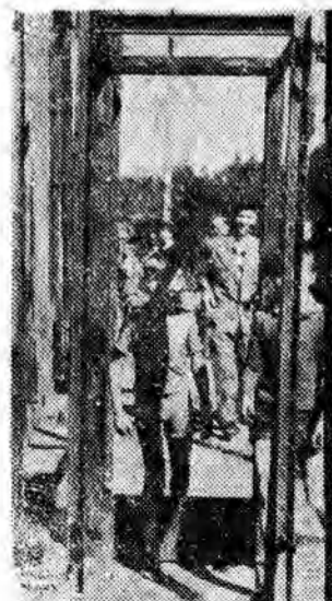
„Drzwi w mieście” (przy ul. Mickiewicza).

— pismo codzienne — wydaje Wydawnictwo Prasowe „Nowiny Rzeszowskie” — RSW „Prasa”. Redaguje kolegium. Adres redakcji: Rzeszów, ul. Zeromskiego 5. TELEFONY: centrala 2556, 2557, redaktor naczelny 4755, z-ca redaktora naczelnego, dział wydawniczy, administracja 4610, dział inf. 4358, dział finansowy 4656, redakcja nocna 5017. Sekretarza redakcji i wszystkie działy redakcji: Krosno, ul. Nowotki 12, tel. 499, Przemysł, ul. Waryńskiego 15, tel. 2700, Tarnobrzeg, ul. 1 Maja bl. 10/1, tel. 294. Biuro Reklam i Ogłoszeń: Rzeszów, ul. Grunwaldzka 42 — tel. 4652. Wszelkich informacji w sprawie warunków prenumeraty udziela placówka „Ruch” i Poręty. Cena prenumeraty miesięcznej — zł 12,50, kwartalnej — zł 37,50, rocznej — zł 150. Druk. Rzesz. Zakł. Graficzne R-1-1019