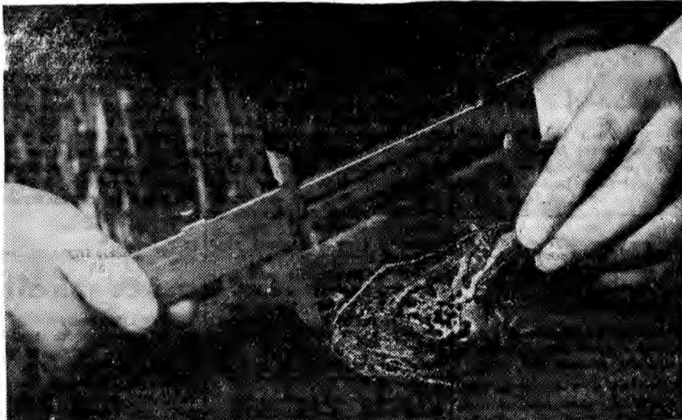
„SKACZĄCE DEWIZY” — Hodowlano - Rolnicza Spółdzielnia Produkcyjna „Czerniaków”, prócz zasadniczych hodowli zajmuje się eksportem żab zielono-wodnych do Francji i Szwajcarii (Paryż, Geneva).