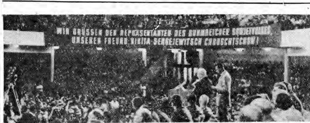
N. S. Chruszczow przemawia podczas spotkania z ludnością Berlina.

Sytuacja baryczna: Europa środkowa jest w zasięgu wyżu barycznego z centrum nad Niemcami. Płytkie układy niżowe zalegają w rejonie Anglii, Spitzbergen i częściowo Rosji. Prognoza pogody: Rano zamglenia, w ciągu dnia zachmurzenie niewielkie, okresami umiarkowane. Po południu lokalnie skłonność do burz i przelotnych opadów. Temperatura dnem od 21 do 27 st., nocą od 10 do 15 Wiatry słabe, zmienne, przeważnie z kierunków północnych.