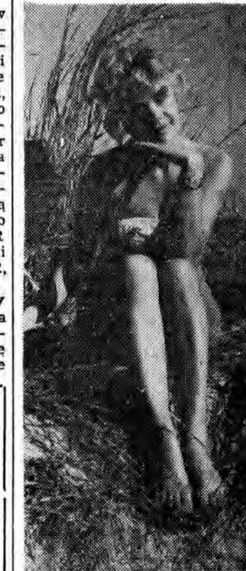
W lipcowym słońcu...

Dziennik turecki „Yeni Sabah“ przynosi wiadomość o nowej zbrodni dokonanej na boju w kurdyjskich przez władze irackie. Według tej informacji w rejonie ZAHO rozstrzelano 35 Kurdów należących do oddziałów Barzaniego.