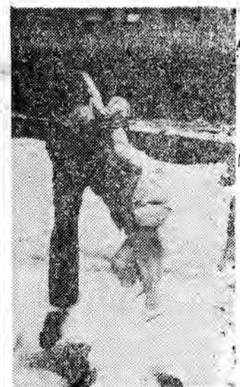
SNIEG W SIERPNIU

Za jednym „przejęciem” koparka zdejmie warstwę ziemi wysokości 50 metrów.