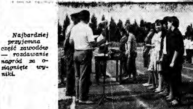
Najbardziej przyjemna część zawodów — rozdawanie nagród za osiągnięte wyniki.