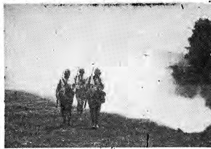
Patrol żelazki pokonuje teren słabo...

Na spartakiadzie wojewódzkiej LOK w Rzeszowie w ogólnej punktacji I miejsce zdobył powiat jasielski, II — usztycki, III — kolbuszowski. Wylonono też reprezentację woj. rzeszowskiego, która weźmie udział w centralnej spartakiadzie kościuszkowskiej LOK. (pras)