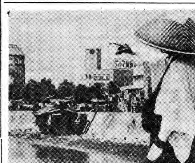
15 lat temu, 8 sierpnia 1945 roku ludzkość zapoznała się po raz pierwszy ze strasliwym grzybem atomowym. Hiroshima zmieniła została z powierzchni ziemi. Tam, gdzie stała tętniące życiem i pracą miasto — pozostało zaledwie kilka budynków, których ściany oparły się potwornej temperaturze i strasliwemu podmuchowi. Dział stoją one jako wieczne pamiętki owego dnia bomby atomowej na przestrogę całego świata. W sztucznym basenie kąpieliska urodzone w nowo wybudowanej Hirosimie.

J. Kadar powiedział dalej, że ci, którzy obecnie w międzynarodowym ruchu komunistycznym występują w roli adwokatów kultu jednostki i metod kultu jednostki, „nie powinni liczyć na nas, ponieważ my, nasza partia i nasz naród mamy dość kultu jednostki”.