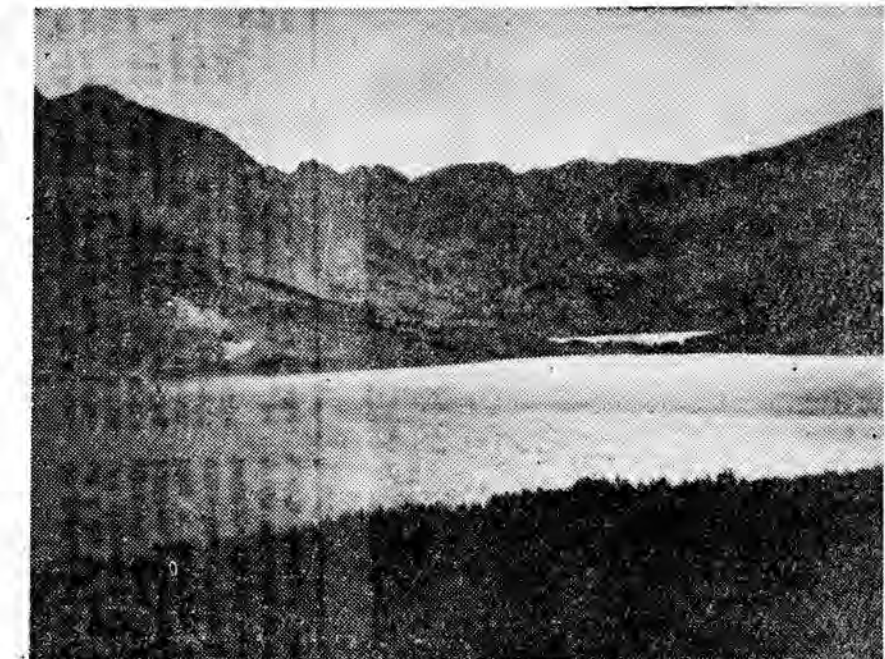
W DOLINIE PIĘCIU STAWÓW

(Według tygodnika „Radio i Telewizja”. Za ewentualne zmiany w programie redakcja nie odpowiada).