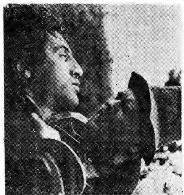
Kadr z filmu „Kozara”.

Jugosłowiański film „KOZARA” reżyserowany przez Veljko Brljicza opowiada nam o jednej z największych bitew partyzanckich II wojny światowej i tragedii górskiej wioski zniszczonej przez hitlerowców. Film zrealizowany został na miejscu bitwy, autorzy zaś postawili sobie za cel możliwie uwiarygodnić historyczne wydarzenia i stworzyć swojego rodzaju filmowy pomnik poległym bohaterom. Warto zaznaczyć, że w rolach partyzanckiego oboje kilku aktorów zawodowych wystąpiła miejscowa ludność, oddającą samą siebie i lat wojny i epizody stoczonych walk.