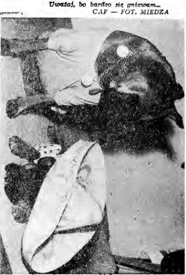
Uważaj, bo bardzo się gniewam...

CASUS: JOD-131 W STANIE UTAH (WJ-AR) Opublikowany w USA specjalny raport podaje wyniki badań przedłużonych wśród ludności stanu Utah w związku z zaobserwowanym tu w ubiegłym roku wzrostem poziomu jodu-131. Ten szkodliwy izotop promieniotwórczy, stanowiący jeden z produktów rozpadu jądrowego, powstał w wyniku doświadczeń z eksplozji nuklearnych. Badania pozwoliły stwierdzić m. in., że oprani... do dwóch lat pochłonią w ciągu miesiąca od 2 do 28 razy większą dawkę jodu-131 niż wynosił roczny, jeszcze bezpieczny dla zdrowia, doza tej substancji promieniotwórczej. Gromadził się ona przede wszystkim w tarczycy. Oddziaływanie fizjologiczno-biologiczne jodu-131 — podkreśla cytowany raport — nie jest jeszcze dostatecznie poznane przez naukę i wymaga dalszych analiz i badań.