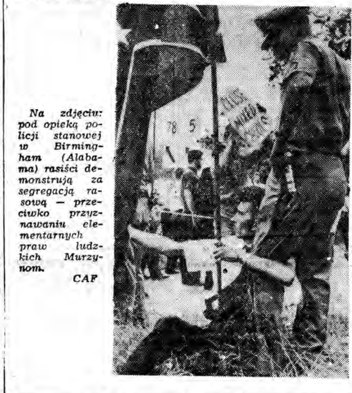
Na zdjęciu: pod opieką policji stanowiącej w Birmingham (Alabama) rasistowskie demonstracje...