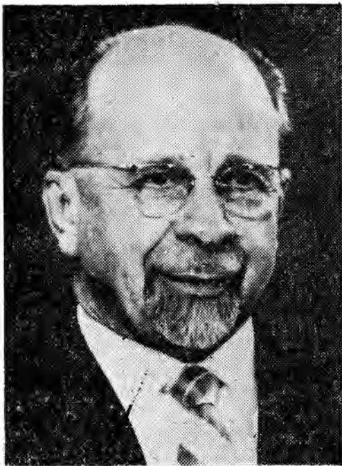
Walter ULBRICHT — sekretarz KC SED i przewodniczący Rady Państwa NRD.

R OZPOCZYNAJĄCA się dziś wizyta gości z Szprewy w naszym kraju jest nie tylko wyrazem stałego zacieśniania się stosunków przyjaźni i współpracy między dwoma krajami po obu stronach Odry. Jest ona także wyrazem dokonanej po II wojnie światowej historycznej zmiany jakościowej w stosunkach polsko - niemieckich. Mówił w październiku ubr. tow. Władysław Gomułka w czasie wizyty polskiej delegacji partyjno - rządowej w NRD: „Między sprawami Polski i Niemiec wytworzył się historyczny spłot. Poprzez całe wieki spłot ten był niedobry. Dla nas Polaków był on wręcz tragiczny, ale i narodowi niemieckiemu zaborcza polity-