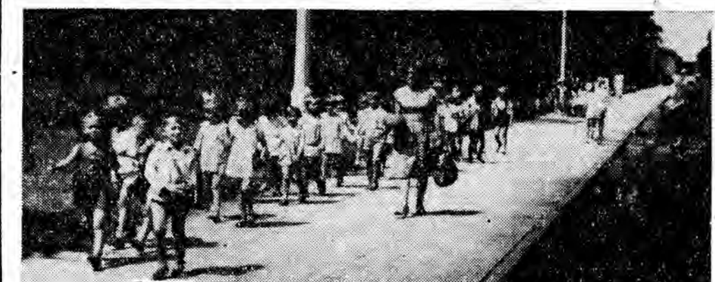
Przedszkolaki na spacerze

Niebawem usłyszymy opinie czeskich myśliwych. Wojewódzka Rada Łowiecka z Krakowa „zamówiła” sobie naszą strzelnicę na zawody strzeleckie, w których zmierzą się krakowscy myśliwi z amatorami dwururki z drugiej strony Tatr.