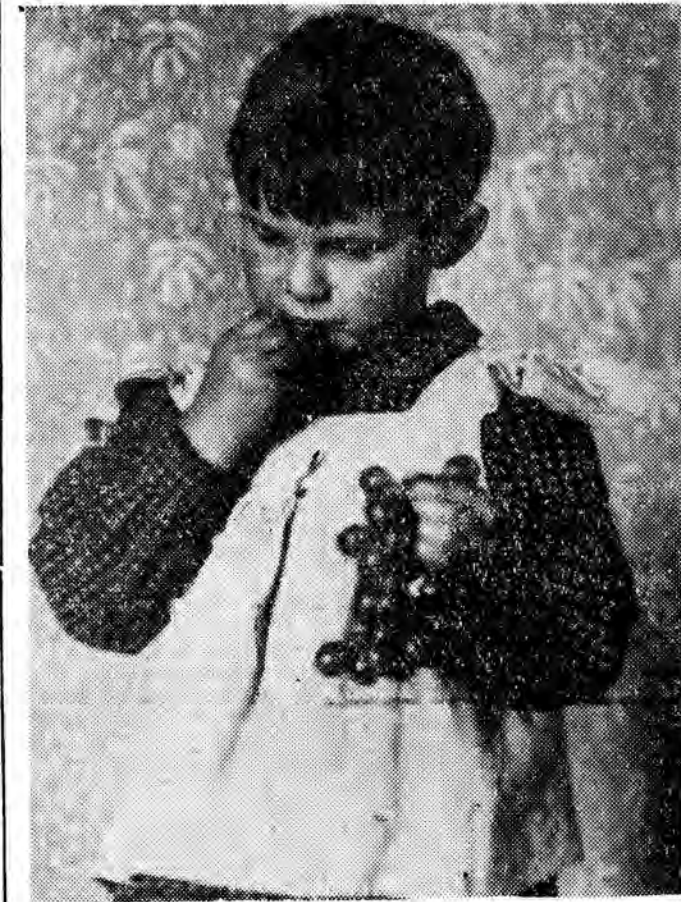
Smak pierwszych winogron

Powiatowy Związek Kółek Rolniczych w Jarosławiu organizuje rejonowe wystawy dorobku zespołów Przystosowania Rolniczego, połączone z egzaminami sprawdzającymi. Członkowie zespołów, którzy złożą egzaminy z wynikiem pozytywnym otrzymają nagrody zespołowe i indywidualne. (a. z.)